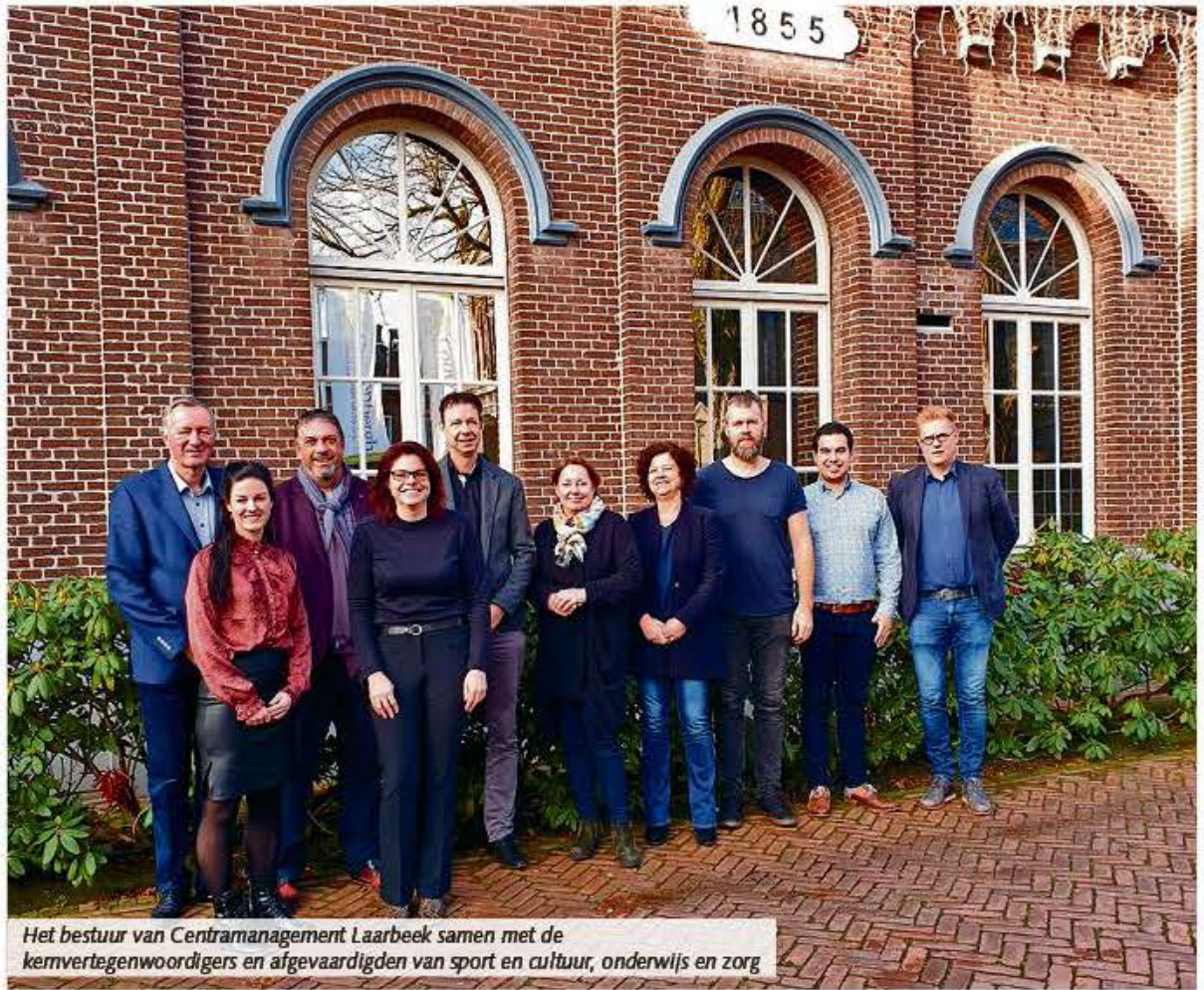
Het bestuur van Centramanagement Laarbeek samen met de kernvertegenwoordigers en afgevaardigden van sport en cultuur, onderwijs en zorg

Laarbeek – Per Ingang van 1 januari 2020 werkt Centramanagement Laarbeek met 5 kernvertegenwoordigers en 3 vertegenwoordigers van sport en cultuur, onderwijs en zorg. Centramanagement Laarbeek hoopt met deze structuur kortere lijnen te realiseren en meer cross-overs te krijgen. De eerste positieve uitwerkingen hiervan zijn al een feit.